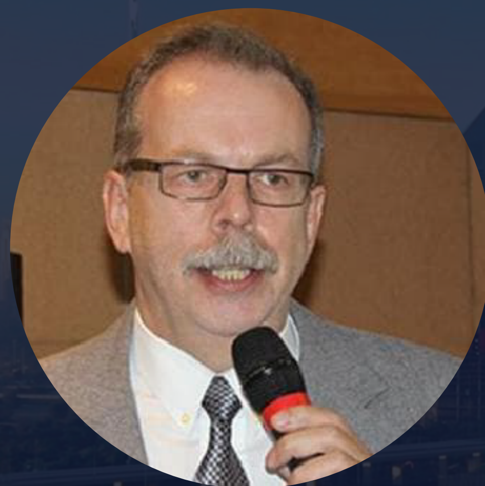
ANDRÉ DE PAULI